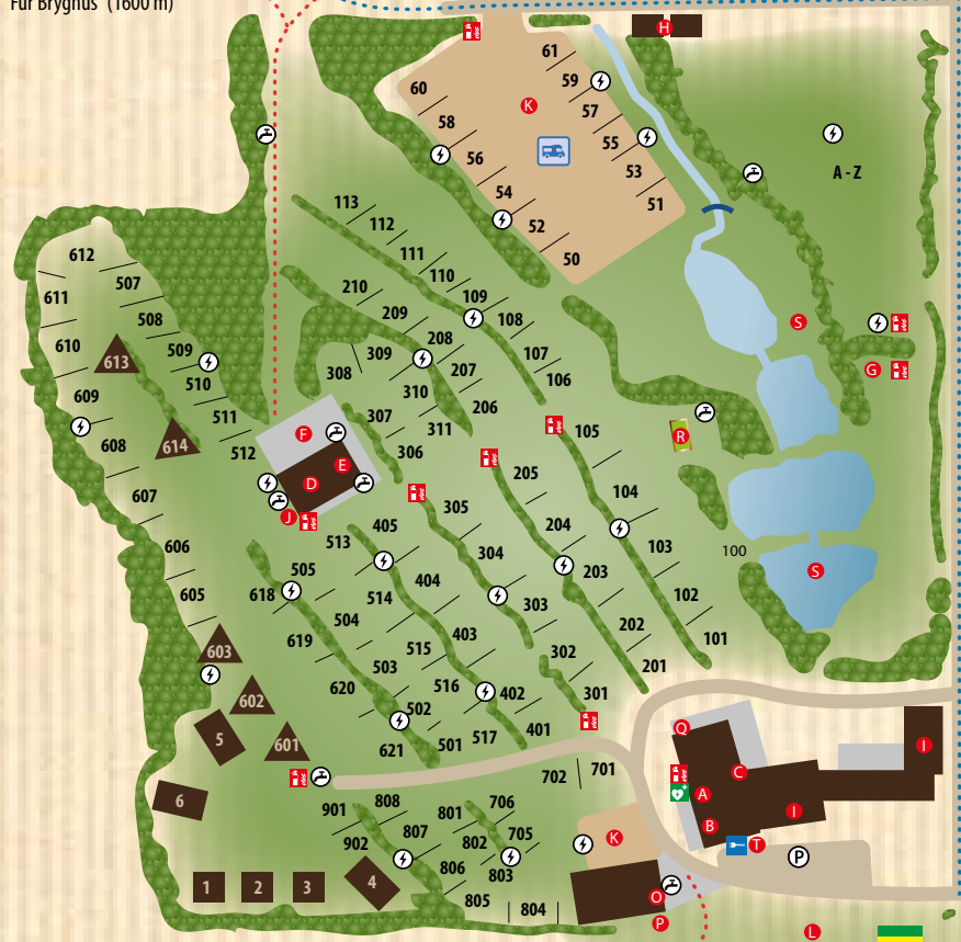
Natursti / Naturpfad / Nature trail / Natuurpad